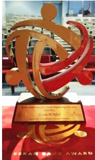
الجائزة حملت شعار "الاستدامة الاجتماعية والاقتصادية في المشاريع الإسكانية"